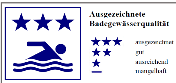
Einstufung gem. EU-Richtlinie 2006/7/EG